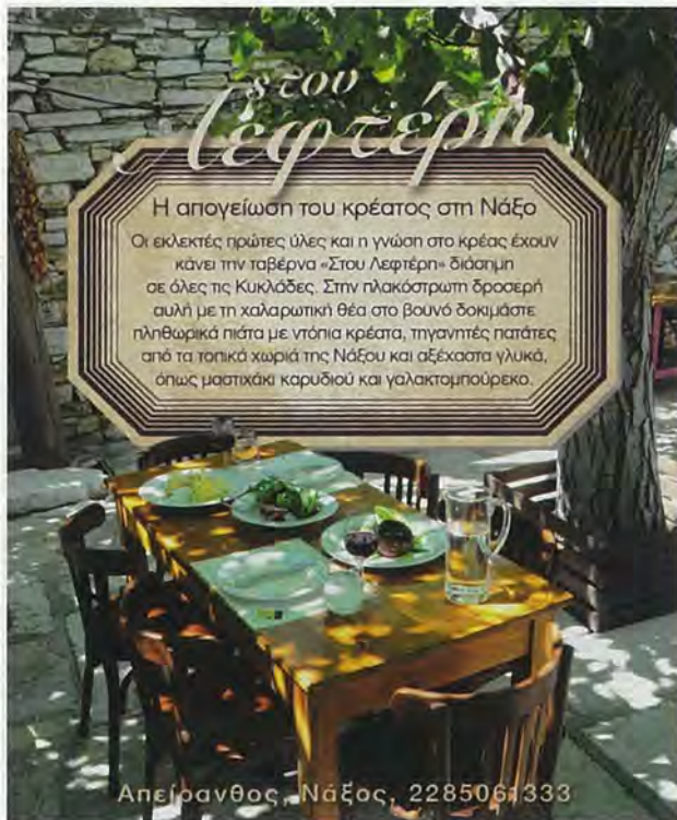
Ανείφανθος, Νάξος, 2285061333

Πού να μείνετε Στο ολοκαίνουργιο «Calme Boutique Hotel» με επτά σουίτες, όλες με εξαιρετικό design και θέα στη θάλασσα. Υπέροχη θέα και από τη βερά-